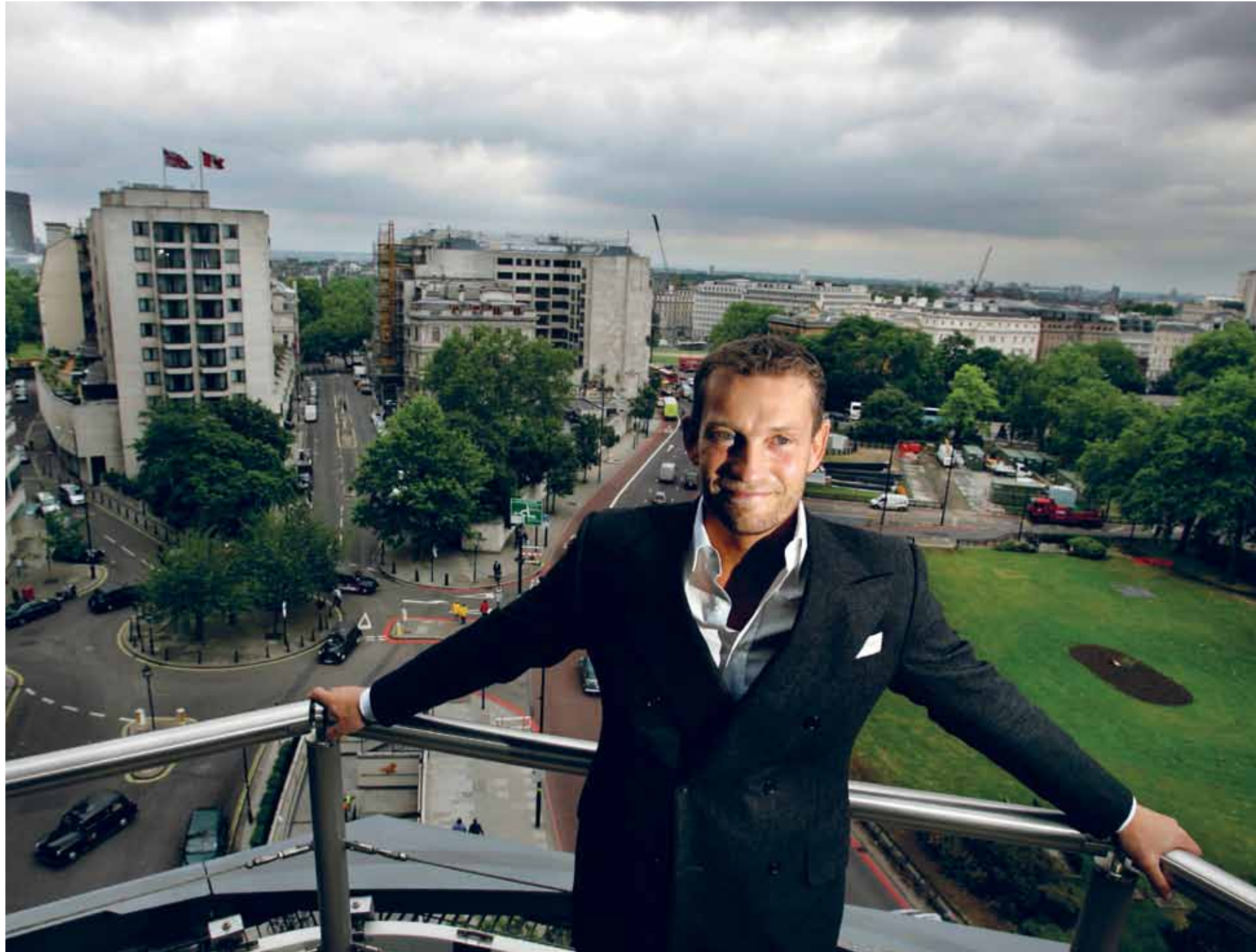
PÅ TOPP. Året er 2006. Björgolfur Thor Björgolfsson fotografertes på balkongen i kontorlokalene til investeringsselskapet sitt Novator i London. Avisen Financial Times kaller ham den mest sexy milliardæren.

- Respekt er det jeg tenker mest på, sa han til magasinet Forbes noen år senere. - Makt og penger er bare midlene for å oppnå respekt.